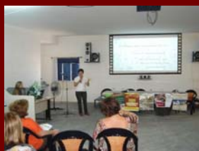
06 de junho de 2009 - Evento Psicoterapia - Caico