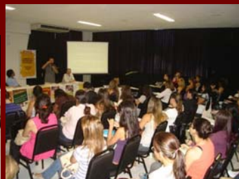
21 agosto de 2009 – Seminário Regional de Psicoterapia – Hotel Arituba - Natal