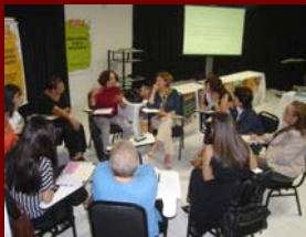
10 julho de 2009 – Evento Psicoterapia Hotel Arituba - Natal