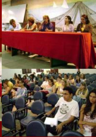
Mesa-redonda sobre educação Inclusiva – CRP-17 e FARN: 28 de abril de 2008.