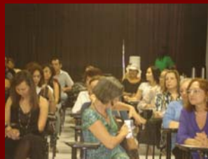
10 julho de 2009 – Evento Psicoterapia Hotel Arituba - Natal