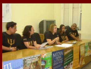
18 julho 2009-Evento Comunicação em Mossoró - RN