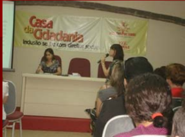
04 julho 2008. I Diálogos CREPOP/RN Casa da Cidadania