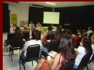
11 julho de 2009 – Evento Psicoterapia Hotel Arituba - Natal