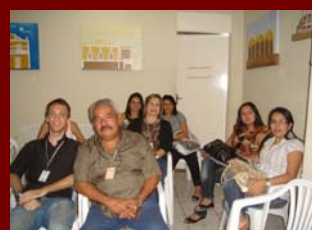
09 agosto de 2008. Encontro de Psicólogos da Região Oeste - Atualizações para o exercício profissional - Currais Novos.