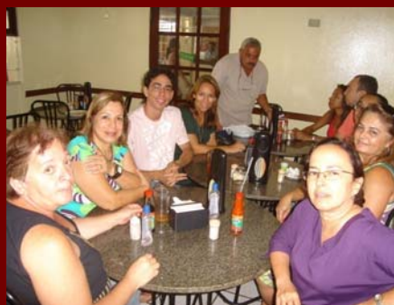
Sábado, 23/2/08: durante almoço da última reunião do planejamento estratégico 2008-10.