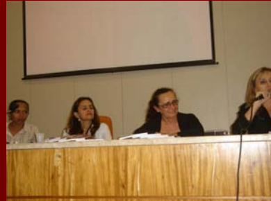
17 de outubro de 2008 – Mesa Redonda nacional on-line E Mesa Redonda Local sobre Trabalho com Idoso. Auditório da Biblioteca Central da UFRN.

O CRP-17, nestes dois anos de funcionamento, realizou eventos e investiu na defesa da presença e atuação dos psicólogos nas políticas e serviços públicos na área da Educação, dos Direitos Humanos, da psicoterapia e da comunicação e intensificou o processo de interiorização do conselho nas regiões oeste e do Seridó, como também se fez representar, politicamente, em reuniões e encontros dentro e fora do sistema conselhos de psicologia,