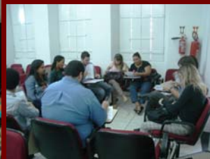
25 julho 2009-Evento Comunicação na OAB-Natal