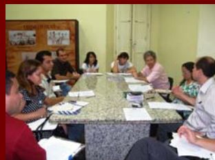
18 julho 2009-Evento Comunicação em Mossoró - RN