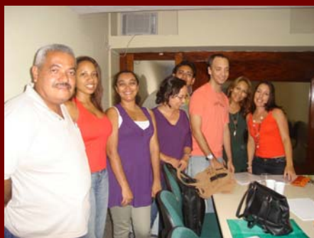
Sábado, 23/2/08: Última reunião do Planejamento estratégico 2008-10.