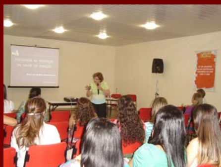
30 de julho de 2009 -IV Jornada de Psicologia em Cardiologia XIX Congresso Norte-Nordeste de Cardiologia