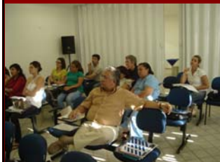
07 de junho de 2008. Encontro de Psicólogos da Região Oeste - Atualizações para o exercício profissional - Mossoró.