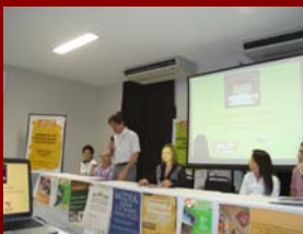
09 julho de 2009 – Evento Psicoterapia Hotel Arituba - Natal

O CRP-17, nestes dois anos de funcionamento, realizou eventos e investiu na defesa da presença e atuação dos psicólogos nas políticas e serviços públicos na área da Educação, dos Direitos Humanos, da psicoterapia e da comunicação e intensificou o processo de interiorização do conselho nas regiões oeste e do Seridó, como também se fez representar, politicamente, em reuniões e encontros dentro e fora do sistema conselhos de psicologia,