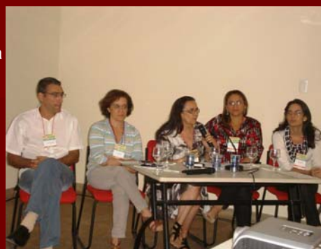
30 de julho de 2009 -IV Jornada de Psicologia em Cardiologia XIX Congresso Norte-Nordeste de Cardiologia