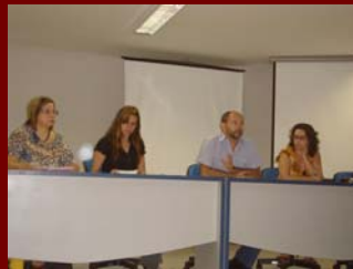
04 de novembro de 2008 Seminário Regional de Educação – Ano Educação

Agosto de 2008 – VII Semana Norte Riograndense de Psicologia e III Jornada Psicologia da UFRN