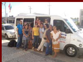
20 de junho de 2009 - Evento Psicoterapia - Mossoró