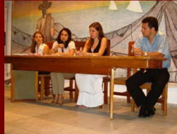
03 de abril de 2009 - Mesa Redonda Evento Educação Básica CREPOP- na FARN